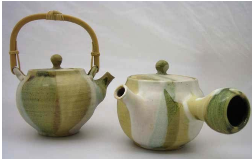
Fig. 3. Motoko Araki: Sin título , sf.

Las experiencias vividas por los artistas japoneses en la Escuela Llotja han sido sumamente provechosas para el desarrollo de sus trayectorias, pero también en sentido inverso su presencia trajo consigo numerosos beneficios para el centro al favorecer sus relaciones con Japón. La afluencia de alumnos nipones a esta Escuela ha dado lugar a colaboraciones con Casa Asia, contactos con papeleros japoneses para el suministro de materiales para los cursos, y proyectos expositivos en Japón donde participaron alumnos inicialmente solo de la Llotja pero luego también de otras escuelas y universidades españolas (AA. VV., 2002; AA. VV., 2004; AA. VV., 2008). Estas experiencias han conllevado también que en la Escuela Massana se hayan realizado trabajos donde el papel japonés se ha utilizado como el material principal para la creación de joyas (AA. VV., 2004: 53).