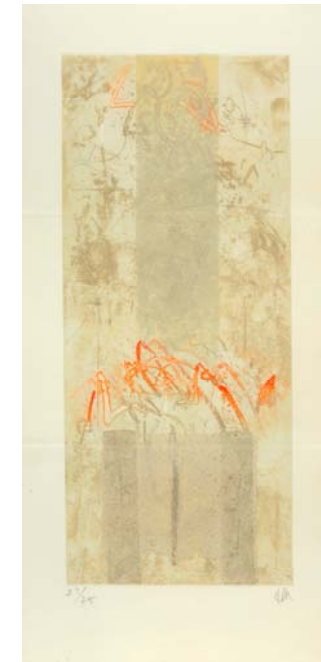
Fig. 4. Masafumi Yamamoto: Tria , 1988.

estos artistas. En las producciones de algunos de ellos destacan características como la simplicidad, la inspiración en la naturaleza, el trazo caligráfico -incluso en los que no practican habitualmente este arte; la linealidad; la ausencia de perspectiva o de luces y sombras; el empleo de materiales como el papel japonés y técnicas como la laca ( urushi ); o la influencia del manga, el anime o la estética kawaii .