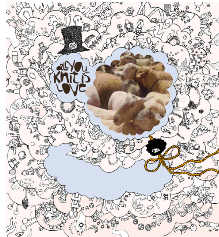
Fig. 6. Yoshi Sislay: All you knit is love , 2010.

No obstante, y pese a que ésta ha sido la tendencia habitual durante décadas, los círculos artísticos catalanes confían cada vez más en los artistas japoneses más jóvenes, lo que les permite afrontar el futuro con un mayor optimismo. Aunque en muchos casos están obligados, al igual que sus compatriotas de generaciones anteriores, a trabajar en empleos muy variados para ganarse la vida (profesores de japonés, de caligrafía o de cerámica, intérpretes, actores, camareros o cocineros en restaurantes japoneses, etc.) poco a poco van logrando más encargos y recibiendo más atención por parte de las instituciones culturales de Cataluña. Así, se van abriendo hueco a través de concursos de arte público, festivales, plataformas virtuales o centros y espacios de experimentación donde se valora el arte emergente y la creatividad por encima de todo.