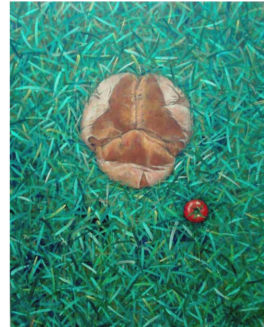
Fig. 2. Koichi Sugihara: Desayuno en la hierba. Pa i tomàquet, 2010.

Por otro lado, en una sociedad patriarcal y machista, como es la japonesa -sobre todo hace unas décadas, aunque en parte todavía hoy en día-, muchas mujeres artistas deciden liberarse y escapar del camino que se les ha impuesto, el cual pasa necesariamente por casarse y tener hijos y, en muchas ocasiones, por abandonar su carrera profesional o, en el caso de mantenerla, doblegarse ante la imposibilidad de optar a las mismas condiciones que un hombre.