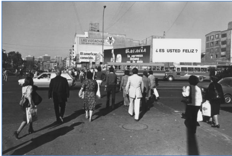
[Fig. 2] Alfredo Jaar, Estudios sobre la felicidad .1981.

Ai Weiwei, uno de los artistas más emblemáticos y polémicos tanto en China como dentro del escenario internacional, fundamenta varias de sus obras en la participación, utilizando para ello la potencialidad de internet para llevar a cabo producciones colaborativas.