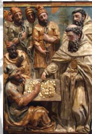
La redención de cautivos por S. Pedro Nolazco. 1599. Museo Nacional Colegio de San Gregorio.