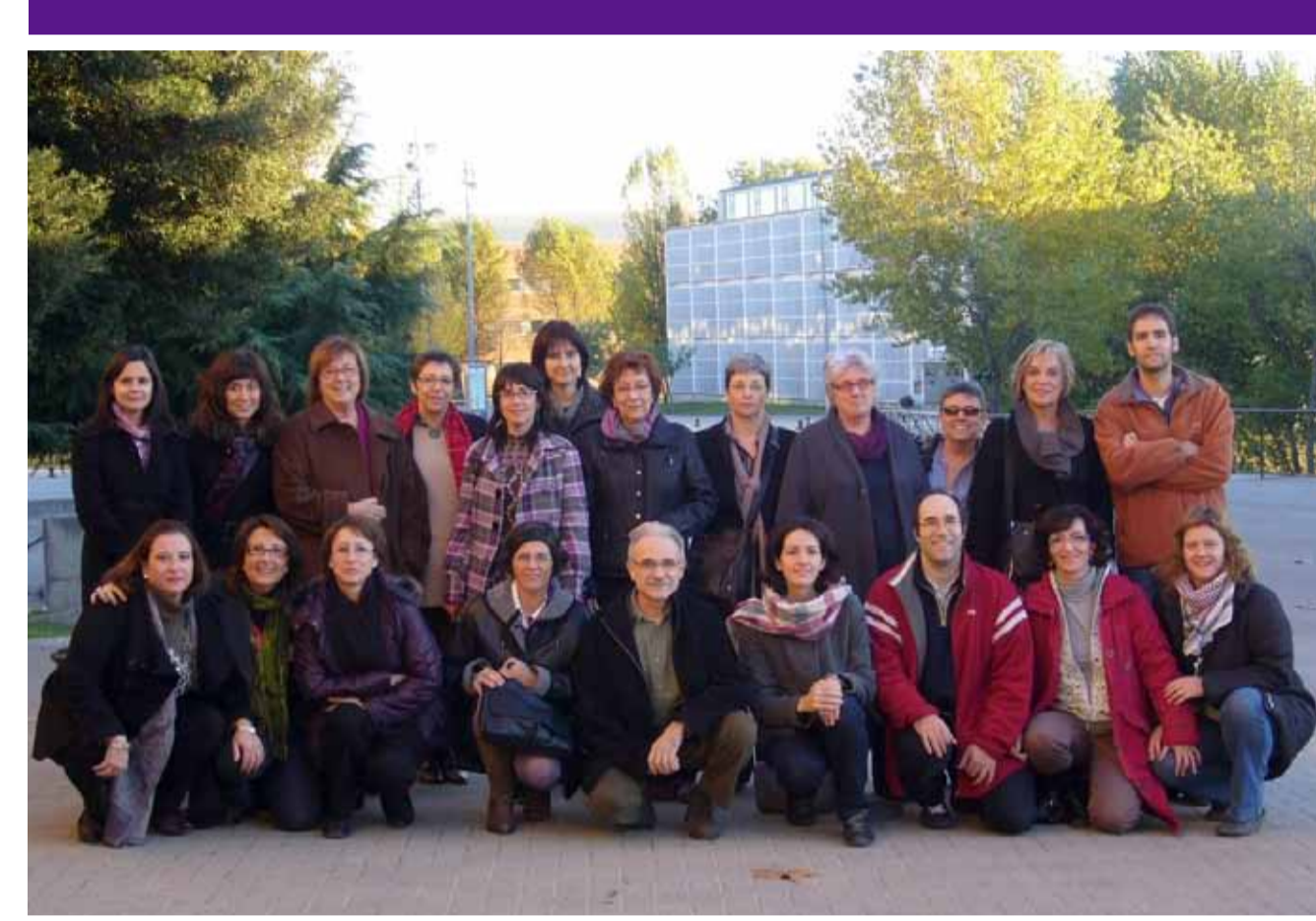
Membres de GREAL a la Plaça del Coneixement (Campus UAB), 2006

La seva metodologia de treball parteix de la idea que el coneixement en didàctica de les llengües s'elabora en interacció entre les aules i la universitat. D'aquesta manera els docents no universitaris han estat des de l'inici membres del GREAL al costat del professorat universitari, i tots junts han col·laborat estretament en l'observació dels processos que tenen lloc a l'aula, en el seguiment de la recerca internacional sobre el tema i en l'elaboració dels resultats que la recerca anava produint.