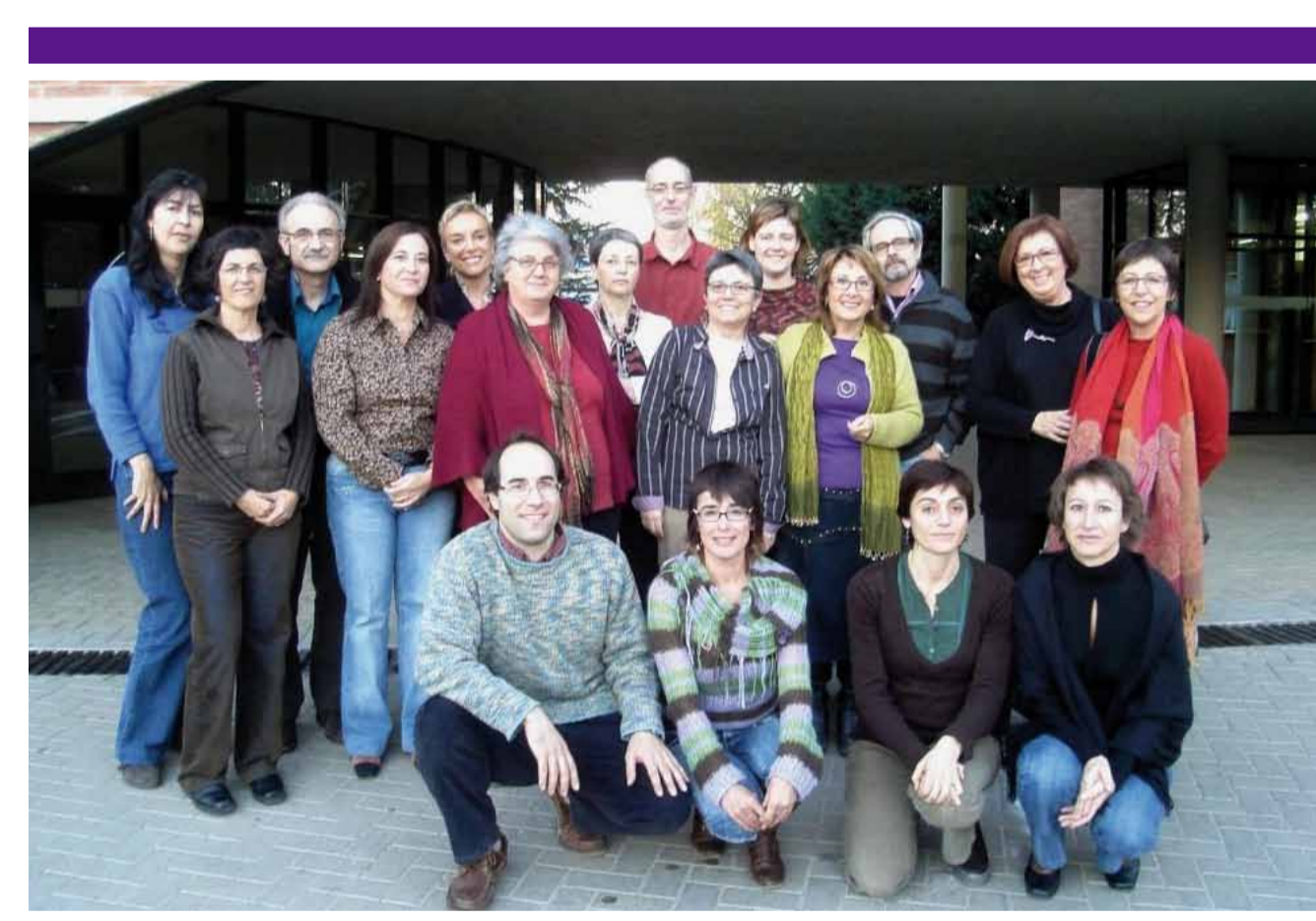
Membres de GREAL davant de l'Edifici G5 (Facultat de Ciències de l'Educació, UAB), 2008