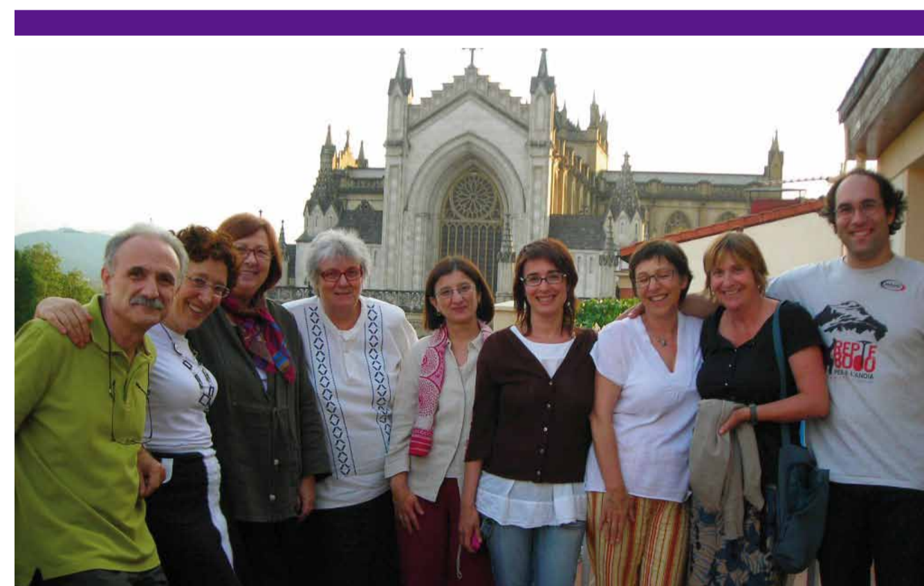
Membres de GREAL al Seminari de Recerca en Didàctica, Vitòria 2007

La seva metodologia de treball parteix de la idea que el coneixement en didàctica de les llengües s'elabora en interacció entre les aules i la universitat. D'aquesta manera els docents no universitaris han estat des de l'inici membres del GREAL al costat del professorat universitari, i tots junts han col·laborat estretament en l'observació dels processos que tenen lloc a l'aula, en el seguiment de la recerca internacional sobre el tema i en l'elaboració dels resultats que la recerca anava produint.