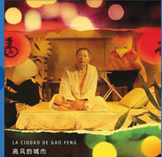
Foto portada: imatge de l'audiovisual "La ciudad de Gao Feng" d'Oriol Martínez