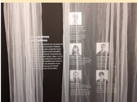
Plafó sobre alertadors de l'exposició "Corrupció! Revolta ètica"

Persona denunciante és la persona física que comunica o revela públicament informació sobre infraccions, obtinguda en el context de les seves activitats laborals.